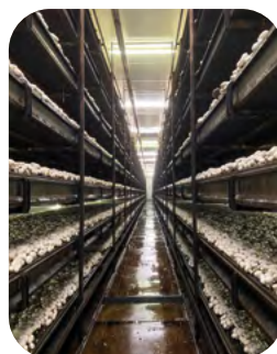
Układ doświadczenia Powierzchnia uprawowa: 1478,4 m 2 , podzielona na 2 kolumny, z których każda obejmowała 7 zagonów uprawowych.

Wynik ten opiera się na rozległym teście praktycznym, przeprowadzonym jesienią 2025 / na początku 2026 r. w dużym zakładzie uprawy pieczarek stosującej zbiór mechaniczny.